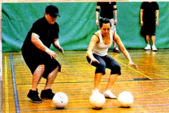
604聯盟的成員多半是20至30多歲的年輕上班族,其中有男有女,亦包括各種族群,大家都因為閃避球這個共同的童年回憶而齊聚一堂。